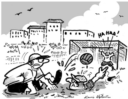
Malaga C.F. rämpiä pohjamudissa