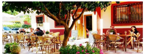
Bar restaurant Kompiss Calle Isaac Peral 3, Los Boliches