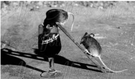
Tio Pepen laaduntarkkailija

JÄTTINUMERO - HINTA ENNALLAAN Paa Stadari fikkaan! Tasaraha 0 euroo!